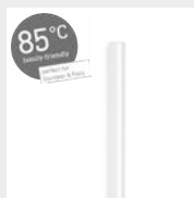
85°C Cristal Klebestick 7 mm