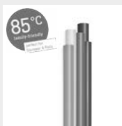
85°C Colour Klebesticks 7 mm