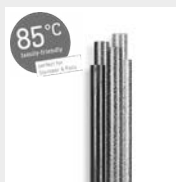
85°C Glitzer Klebesticks 7 mm