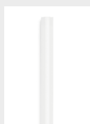
Ultra Power Klebesticks 7 mm