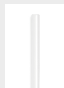
85°C Cristal Klebesticks 7 mm